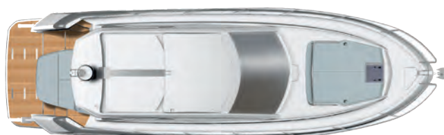
TOP VIEW (HARD-TOP CLOSED) VUE DU DESSUS (TOIT FERMÉ)