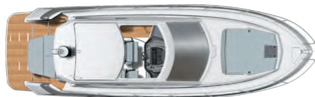
TOP VIEW (HARD-TOP OPEN) VUE DU DESSUS (TOIT OUVERT)